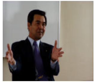
六月二十日例会議案を絞り込んで・・・

去る、六月二十日に開会された六月定例議会は、アユ資源対策のための補正予算を始め、琵琶湖森林づくり県民条例案など六十議案の審議、人事案件八議案、合計六十八議案の全ての議案を可決し、七月八日閉会をいたしました。